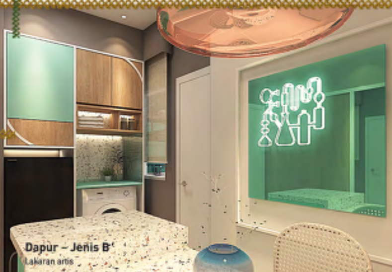
Dapur – Jenis B Lakaran artis