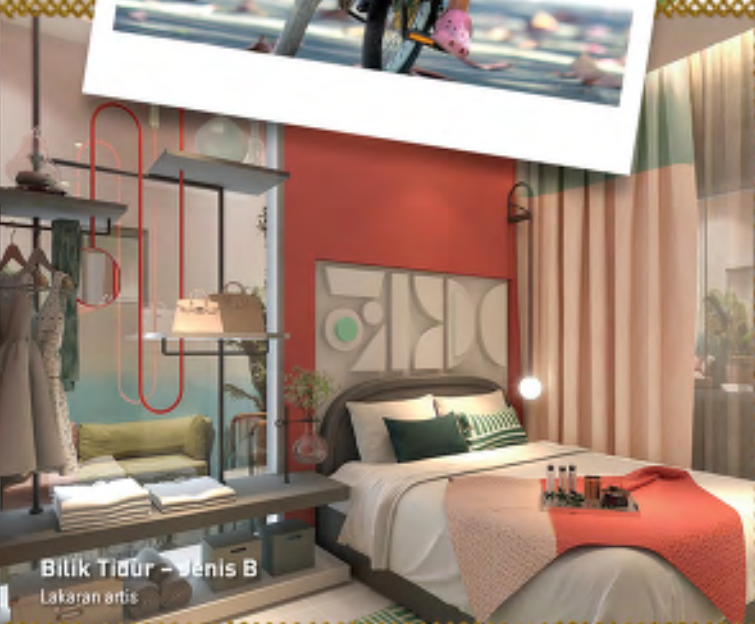
Bilik Tidur – Jenis B Lakaran artis

Berinspirasi semangat hidup berkemuniti, KITA Ria dilengkapi dengan pelbagai kemudahan seperti kolam renang, dewan serbaguna, taman permainan kanak-kanak dan gelanggang permainan bagi menggalakkan gaya hidup harmoni.