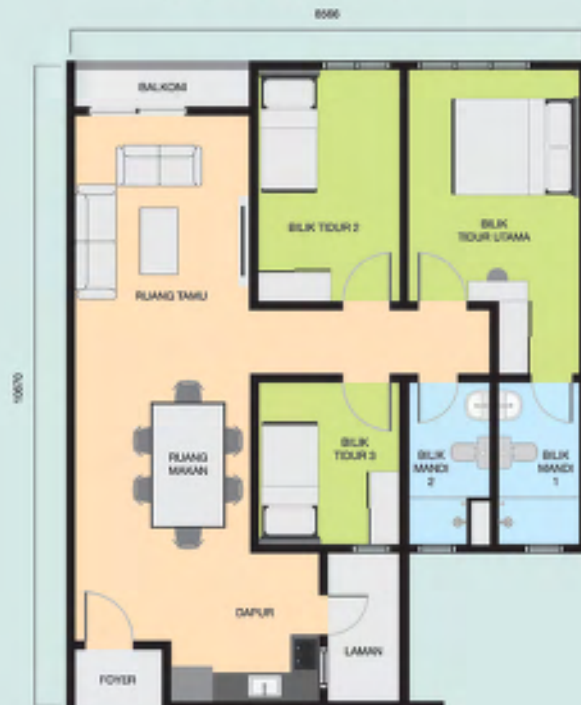
(JENIS A) 901 KPS