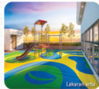
Taman Permainan Kanak-kanak